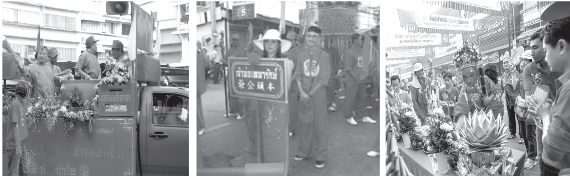
ภาพที่ 2 ขบวนแห่เจ้าพ่อ-เจ้าแม่ปากน้ำโพในเทศกาลตรุษจีน