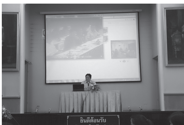
ภาพที่ 1 กระบวนการแลกเปลี่ยนเรียนรู้ระหว่างชาวไทยเชื้อสายจีนกับชุมชนท้องถิ่นในตำบลปากน้ำโพ