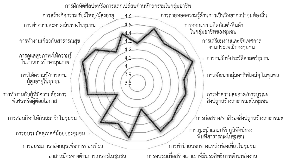
แผนภูมิที่ 2 แสดงความต้องการในชุมชนมอญบางกระดี่ในการสร้างกิจกรรมการท่องเที่ยวเชิงอาสาสมัคร