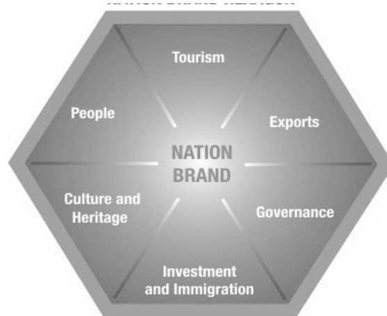
ภาพที่ 2 : Nation Brand Hexagon

(1) รอยยิ้ม ความเป็นมิตร การเข้าใจผู้อื่น การมีบุคลิกภาพที่ดีของคนไทยในการบริการ (2) ความเป็นคนไทย จากบุคลิกภาพและทัศนคติที่พบ อาทิ ความสนุกสนาน เฮฮา ความโรแมนติก (3) ความคุ้มค่าเงิน คุ้มค่าเวลา (4) การบริการสปาไทย และความหลากหลายของการบริการด้านการท่องเที่ยวเชิงสุขภาพ และความงาม